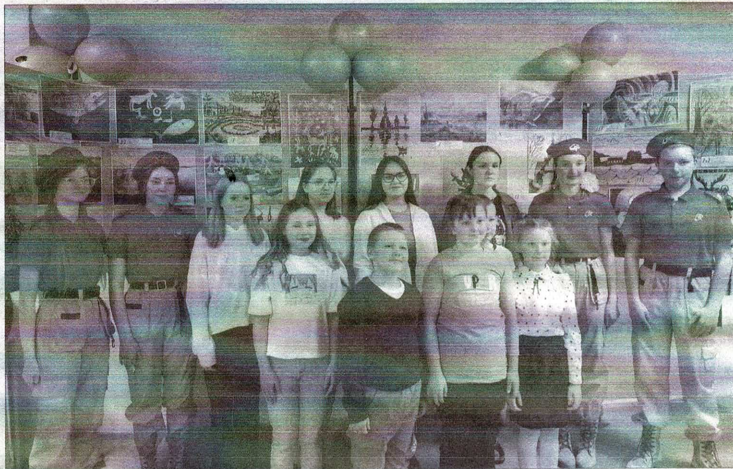
Ученики школ искусств Мурманской области выразили любовь к Северу в живописной и стихотворной формах.

рой числится и редакция газеты «Городское время», был представлен на международный грантовый конкурс «Православная инициатива — 2022» фонда «Соработничество» среди некоммерческих организаций. Кроме того, компаниями-участниками проекта стали ДШИ городов Кандалакша, Полярные Зори, н.п. Африканда, пгт. Зеленоборский, Умба, приход храма Святой Живоначальной Троицы г. Полярные Зори.