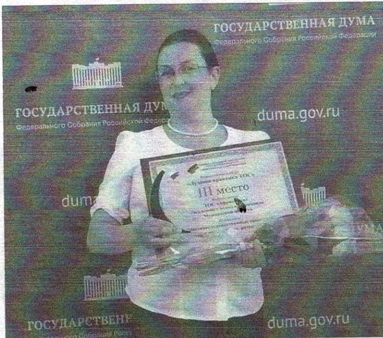
Для ТОСа Африканды третье место по России - большая победа!

Такие вопросы поднимались на общем собрании, которое